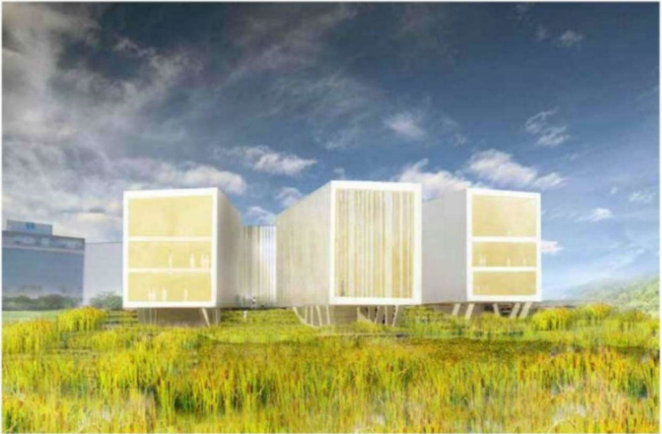
Vista da Via San Mauro